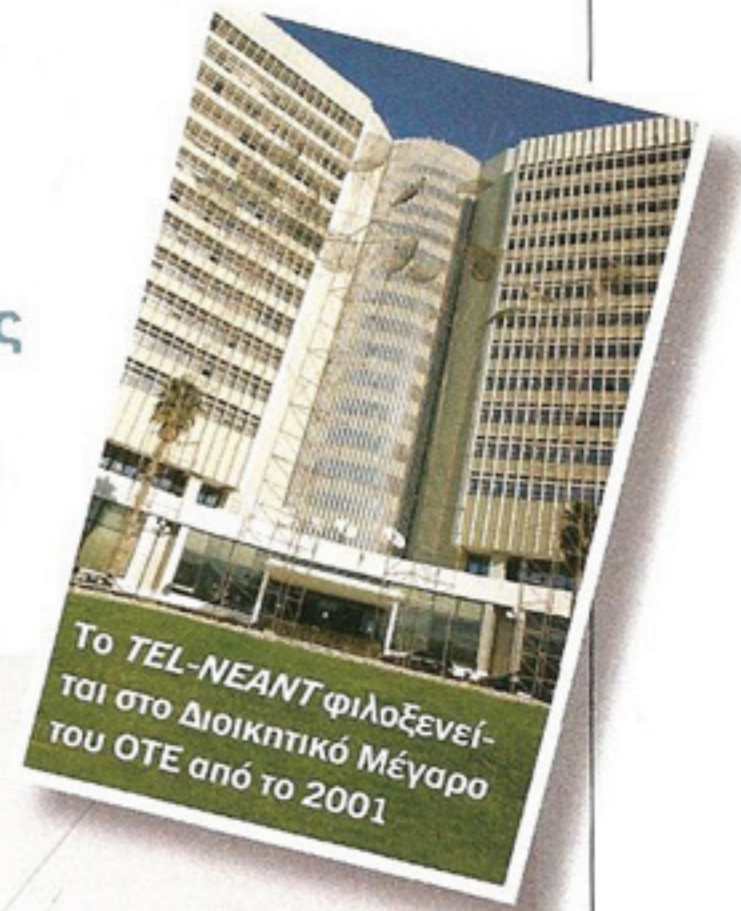
Το TEL-NEANT φιλοξενείται στο Διοικητικό Μέγαρο του ΟΤΕ από το 2001

Το έργο παρουσιάστηκε το 1997 στη Riva Dei Giardini κοντά στην είσοδο της Biennale της Βενετίας πάνω σε πλατφόρμα μέσα στην θάλασσα. Το 1998 εκτέθηκε στην πλατεία Wittenberg του Βερολίνου, μπροστά από το Ελληνικό Ίδρυμα Πολιτισμού, ενώ το 1999 εκτέθηκε σε κεντρική πλατεία της Βαϊμάρης στην Γερμανία. Το 2001 αγοράστηκε και τοποθετήθηκε στο Μέγαρο του ΟΤΕ στο Μαρούσι ενώ από το 2005 μέχρι και σήμερα αντίγραφο του έργου σε μικρότερες διαστάσεις βρίσκεται στον κήπο του Προεδρικού Μεγάρου. Ευχαριστούμε το Ίδρυμα Γεωργίου Ζογγολόπουλου για τα στοιχεία που μας παραχώρησε.